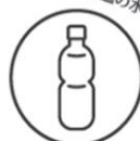
水分 (フタ付きの容器)